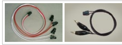
心拍出力用リード線 (BN-EL50-LEAD2) (BN-EL50-LEAD4)