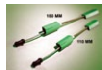
回転角トランスデューサ (BN-TOR-110-XDCR)110mm用 (BN-TOR-150-XDCR)150mm用