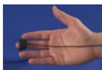
脈派トランスデューサ (BN-PULSE-XDCR)