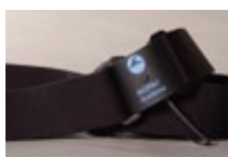
呼吸トランスデューサ (BN-RESP-XDCR)