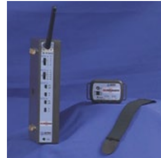
トランスミッタ&レシーバ