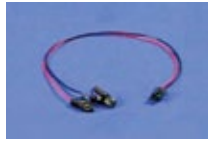
皮膚電気反応用リード線 (BN-EDA-LEAD2)