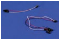
心電図、筋電図、脳波用リード線 15cm,30cm,45cmの3タイプ。 BN-EL15-LEAD2 BN-EL15-LEAD3 BN-EL30-LEAD2 BN-EL30-LEAD3 BN-EL45-LEAD2 BN-EL45-LEAD3