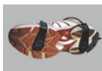
踵&つま先接地トランスデューサ (BN-STRIKE-XDCR)